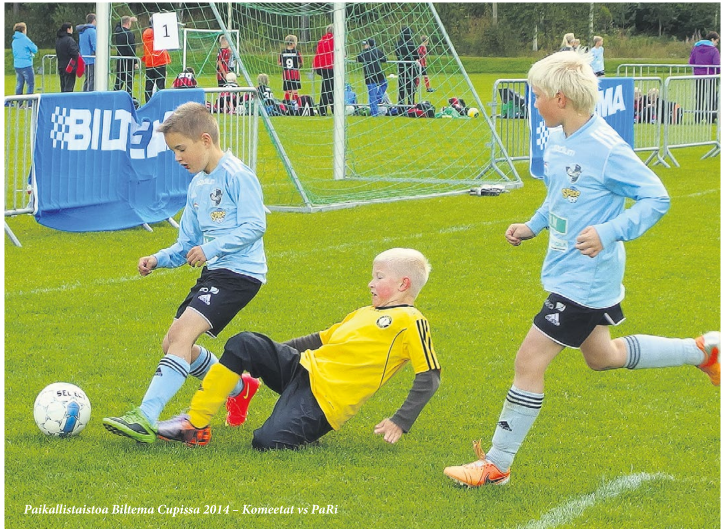
Paikallistaistoa Biltema Cupissa 2014 – Komeetat vs PaRi