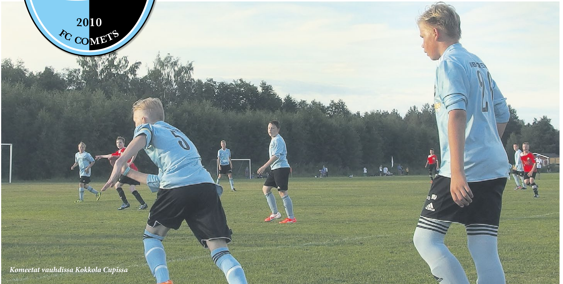
Komeetat vauhdissa Kokkola Cupissa