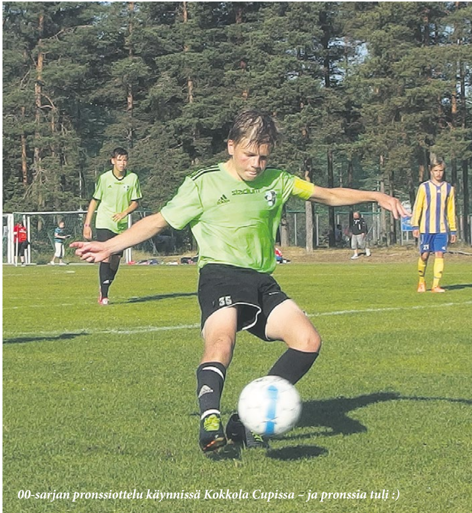
00-sarjan pronssiottelu käynnissä Kokkola Cupissa – ja pronssia tuli :)

Niille, jotka rakastavat suomalaista jalkapalloa ei elämä aina ole kovin helppoa. Via Dolorosaksi on sitä kuvattu ja kyllä A-maajoukkueen edesottamusten seuraamisesta toden totta voi löytää monia yhtymäkohtia esi-